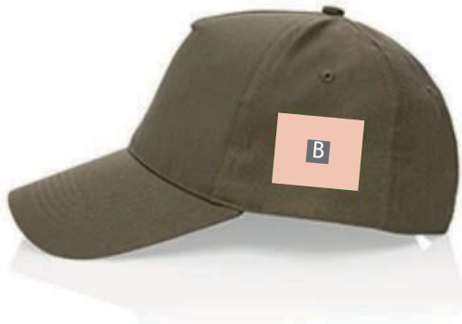
en el lado izquierdo